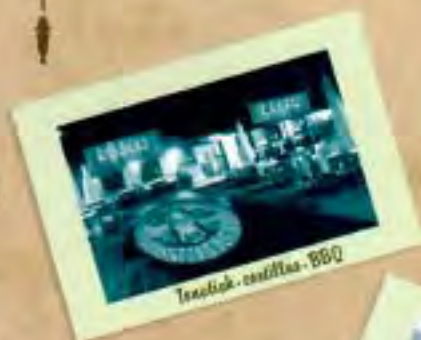
Tonatihu - tortitas - BBQ

Lechuga, tomate, cebolla frita, pollo crujiente rebozado bañado con nuestra genuina salsa de mostaza.